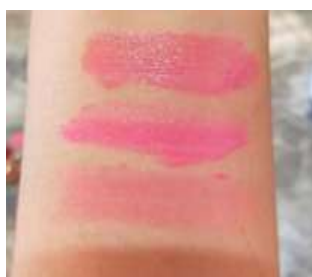
Gambar 4. Hasil uji iritasi

Uji iritasi dilakukan secara topikal dengan mengoleskan sediaan lipstik pada bagian lengan dan kulit punggung tangan, membiarkannya terbuka selama 15 menit, kemudian mengamati reaksi yang terjadi. Kemerahan, gatal atau bengkak menunjukkan reaksi iritasi positif. Hasil uji iritasi pada ketiga formula lipstik menunjukkan bahwa semua formula lipstik tidak menyebabkan iritasi pada kulit.