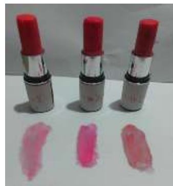
Gambar 1. Uji Organoleptis Lipstik

Hasil uji organoleptis menunjukkan bahwa semua formula lipstik memiliki warna yang sesuai dengan konsentrasi sari buah binahong yang digunakan. Semakin tinggi konsentrasi sari buah binahong, maka warna lipstik semakin pekat yaitu merah keunguan. Semua formula lipstik memiliki bau yang khas dari fragrance lily dan tekstur yang lembut dan mudah dioleskan.