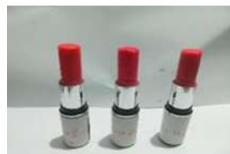
Gambar 5. Lipstik pada suhu ruang

Pada suhu ruang maupun suhu dingin ketiga formula lipstik menunjukkan stabilitas warna, bau, dan bentuk yang sama selama empat minggu pengamatan.