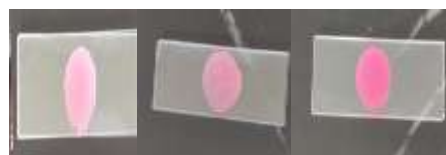
Gambar 2. Uji homogenitas formula 1,2,3

Hasil uji homogenitas menunjukkan bahwa ketiga formula lipstik memiliki homogenitas yang baik, yaitu tampak merata tanpa butiran kasar.