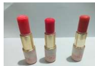
Gambar 6. Lipstik pada suhu dingin

Lipstik pada suhu dingin cenderung lebih kokoh dan tidak lembek dibandingkan dengan suhu ruang, hal ini disebabkan oleh perubahan viskositas bahan-bahan pembentuk lipstik pada suhu dingin sehingga konsistensi lipstik lebih padat dan kompak.